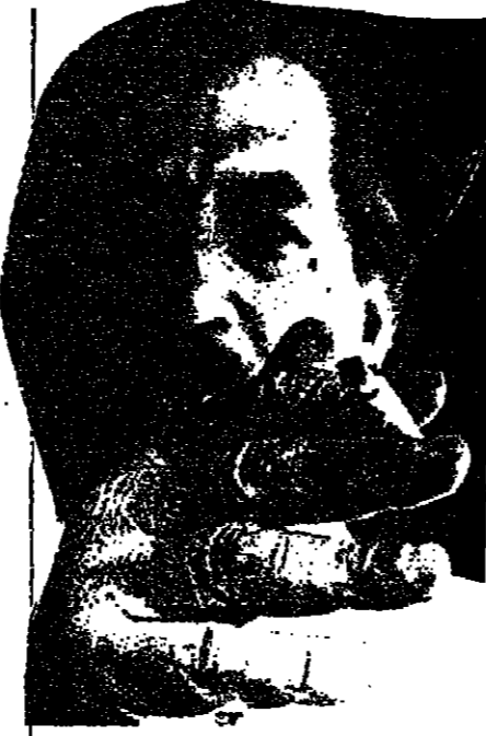
البرازيليين والأتراك يفضلون التدخين التارجيلة

بينما يحب فريق من أهل سويسرا تدخين التبغ في طاس مصنوع من الفخشي، ويدهنونه باليابون والمينيون في قصبه. التدخين ومضاره